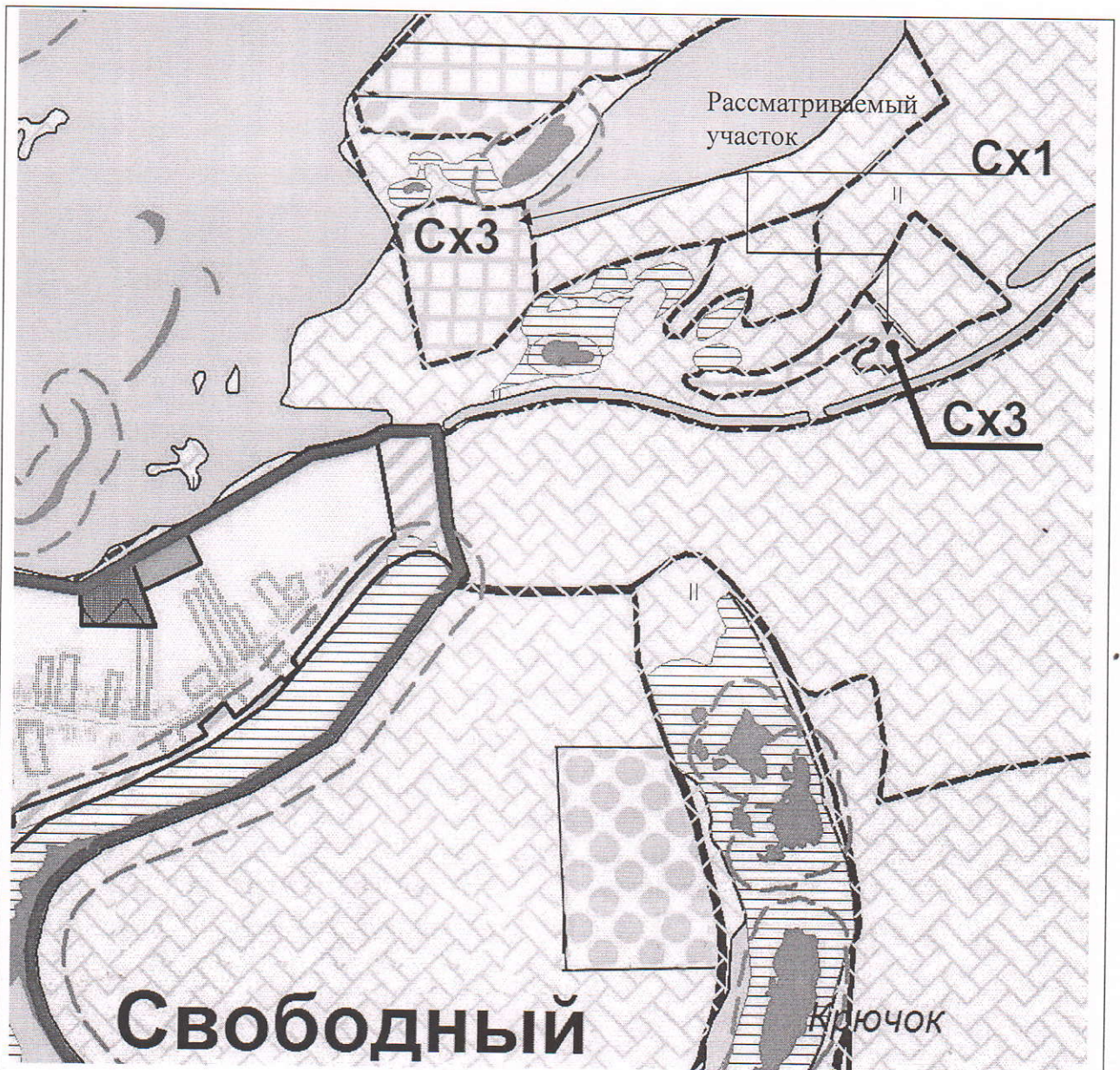
Рисунок 1. Участок северо-восточнее п.Свободный площадью 55000 кв.м, являющийся частью земельного участка с кадастровым номером 63:22:0000000:508.