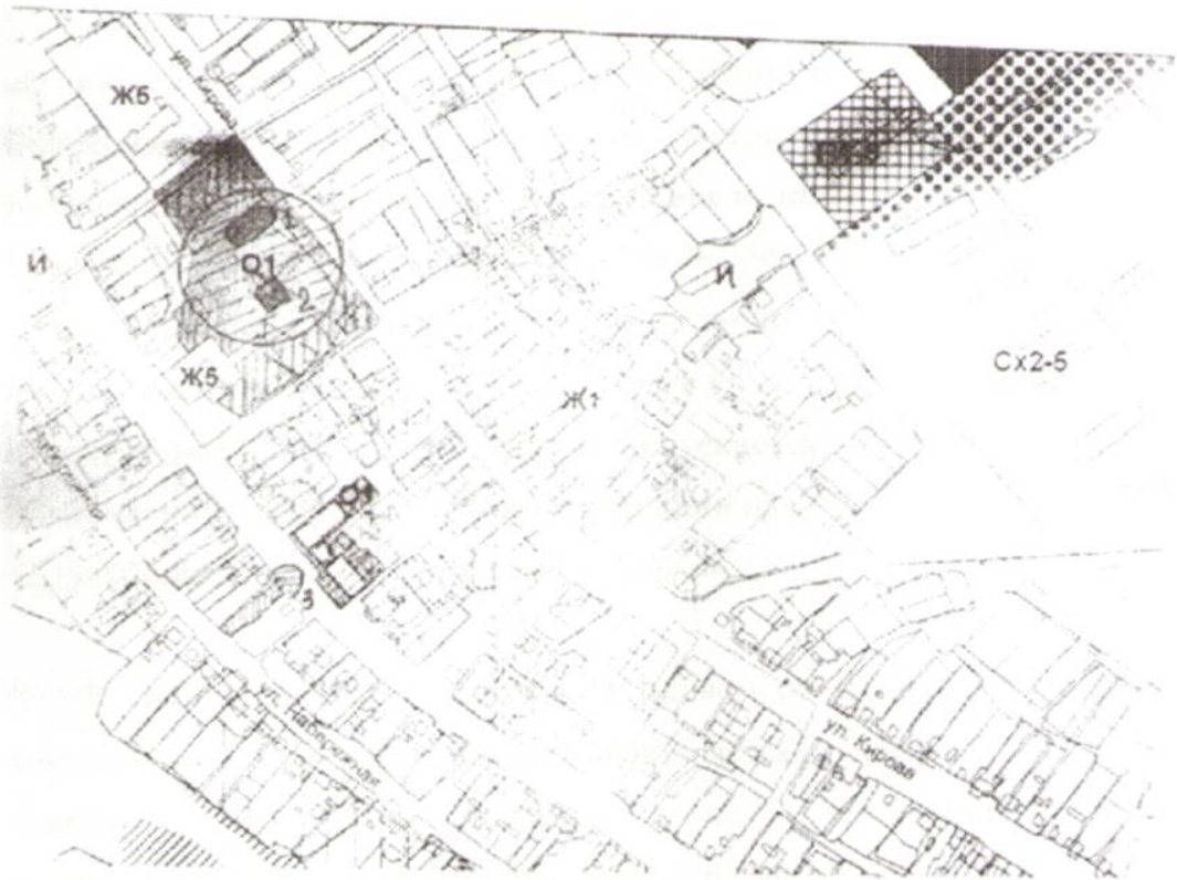
Схема границ прилегающих территорий к организациям и объектам, на которых не допускается розничная продажа алкогольной продукции